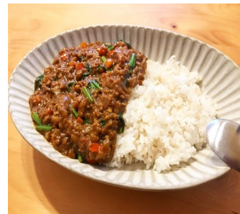
写真はあくまでイメージです。