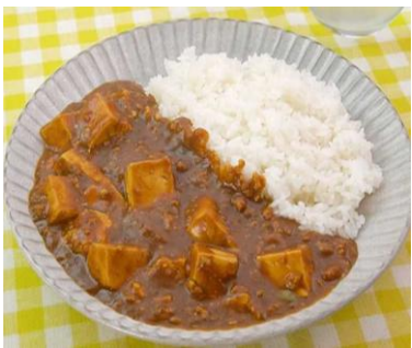
写真はあくまでイメージです。