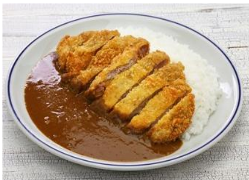
写真はあくまでイメージです。 提供するものとは異なります