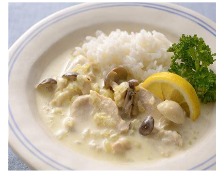
写真はあくまでイメージです。 提供するものとは異なります