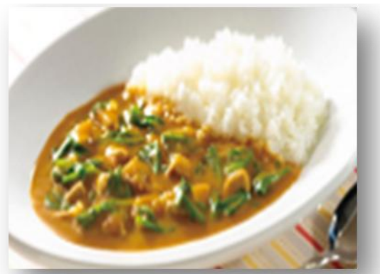
ビーフほうれん草カレー