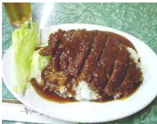
写真はあくまでイメージです。