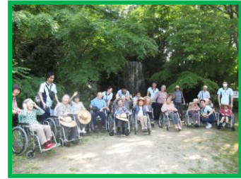
レクリエーション委員会