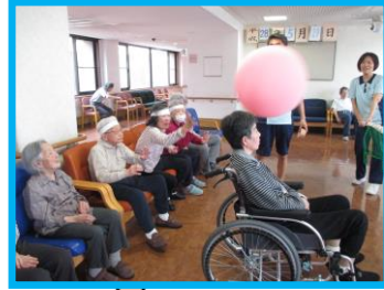
レクリエーション委員会

ご利用者の皆様と一緒にスタッフも参加させていただき、とても白熱して盛り上がりました。皆様から、「いい汗をかいたわ。」「久しぶりに興奮しちゃったよ。」「などのお声をたくさんいただきました。