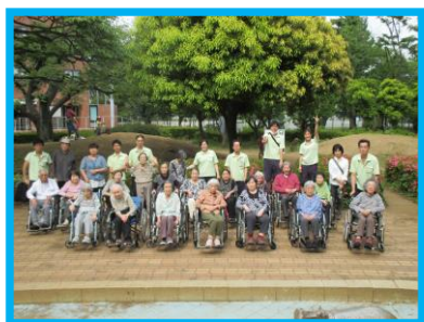
昨年の外出行事の様子

「更新」「区分変更」などで、新しい介護保険証がお手元に届きましたら、受付までお持ち下さい。来所の予定が無い場合は、電話にてご一報いただくか、FAXにてお送りください。