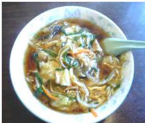
写真はあくまでイメージです。