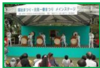
例年の福祉まつり