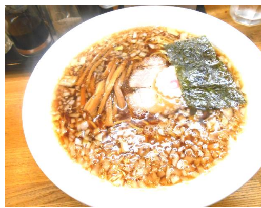
写真はあくまでイメージです。提供するものとは異なりますのでご了承下さい

利用料のお支払いは毎月十五日までとなっておりますのでご協力ください。 尚、窓口でのお支払いは「年中無休」・「午前九時〜午後四時」となっています。