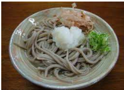
写真はあくまでイメージです。 提供するものとは異なります