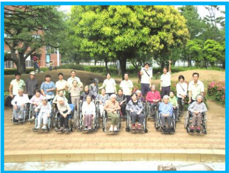
公園での全体写真

ご利用者の皆様から、「久しぶりに外へお出かけできてよかった」「こういう企画はいいね。楽しかったよ」など、たくさんのお声をいただきました。また、皆様がりフレッシュできるような企画を随時企画したく思います。