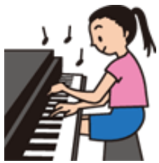
レクリエーション委員会より

五月十七(日曜日)、五月の行事として、「演奏会」を開催しました。当日、ボランティアの「悠・遊」様にご来設いただき、バイオリンとピアノの演奏を披露していただきました。バイオリンの優しい音色、リズムミカルなピアノの音に、皆様にはくつろいだ素敵な時間を過ごしていただきました。また、お馴染みの歌謡曲も演奏してくださり、演奏に合わせて大きな声で合奏されておりました。皆様から、「素敵な音色で癒された。」「是非また来ていただきたいね。」などの声が聞かれました。「悠・遊」の皆様、ご来設ありがとうございました。