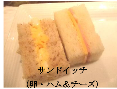
サンドイッチ (卵・ハム&チーズ)

あらかじめ、皆様にはメニューの中から好きな「おやつ」・「飲み物」を選んで頂き、職員がご注文の品を席まで運び召し上がって頂きました。外出することの少ないご利用者の皆様には、多少なりとも喫茶店の雰囲気を感じてもらったことができたようで、楽しい催しとなりました。