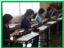
レクリエーション委員会より

ご利用者の皆様から「良かったわ。いい音色だったね。」「むかし、私も大正琴をやっていたの。懐かしかったわ。」などのお声を多数いただきました。「かすみ草の会」と「おしどり会」の皆様、お忙しい中ご来設いただき、ありがとうございました。