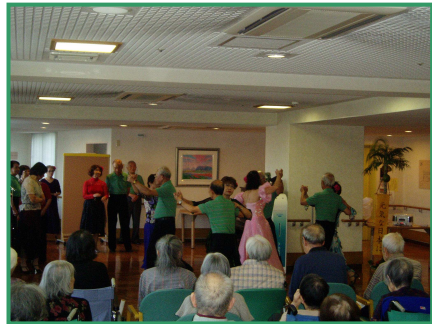
社交ダンスの様子

十月二十四日(木)、年に一度お越しいただいているレッスンスワンの皆様は総勢二十名ご来設し、社交ダンスの披露をしていただきました。華麗な衣装とステップにご利用者の皆様も興味津々で心躍らせて、鑑賞されていました。レッスンスワンの皆様、ご来設ありがとうございます。