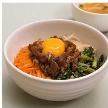
写真はあくまでイメージです。

丼丼グルメ「ビビンバ丼」 ビビンバは、たっぷりの野菜とお肉を混ぜていただく、栄養満点で見た目も楽しい韓国の定番料理です。