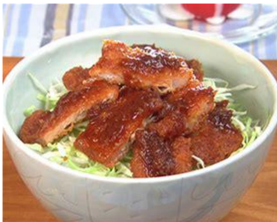
写真はあくまでイメージです。