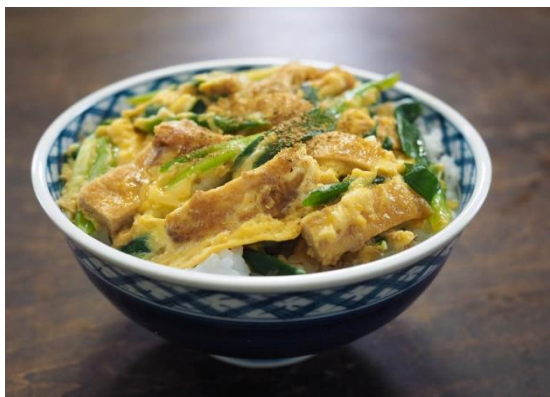
写真はイメージです。お出しするものとは異なりますのでご了承下さい。