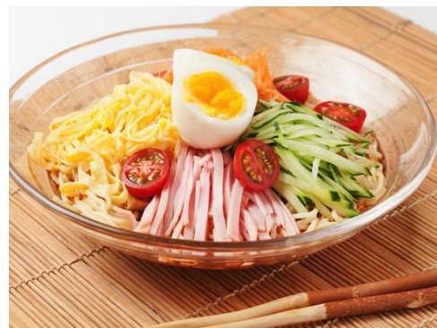
写真はあくまでイメージです。 提供するものとは異なりますのでご了承下さい