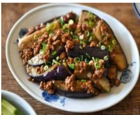
写真はイメージです。お出しするものとは異なりますのでご了承下さい。