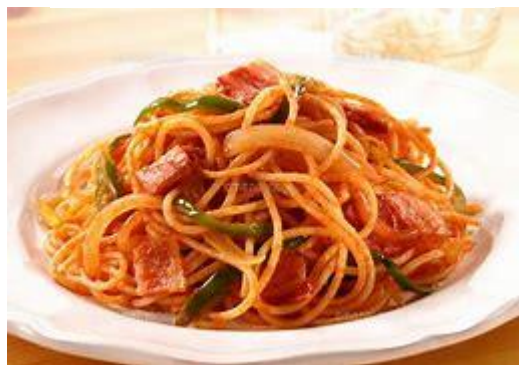
写真はイメージです。お出しするものとは異なりますのでご了承下さい。