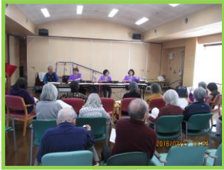
レクリエーション委員会より

三月十八日(日曜日)に、三月の行事として、「かすみ草の会」の皆様による、大正琴の演奏会を行いました。大正琴の音色がとても心地よく、皆様ご存知の曲目のときには、音にあわせて合唱したり、手拍子したりと楽しいひと時を過ごされました。ご利用者の皆様から「今日は、一杯歌も歌えて良かったわ。」「いい音色だった。」「知ってる歌ばかりだったから良かった。」「などのお声を多数いただきました。」「かすみ草の会」の皆様、お忙しい中ご来設いただき、ありがとうございます。