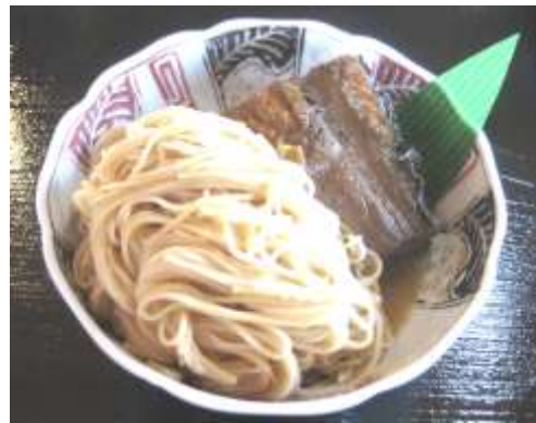
写真はあくまでイメージです。提供するものとは異なりますのでご了承下さい