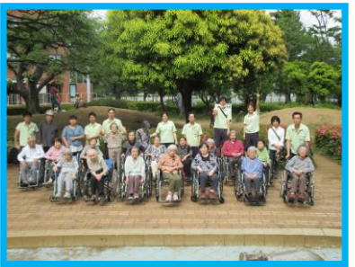
例年の外出行事の様子