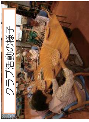
クラブ活動の様子