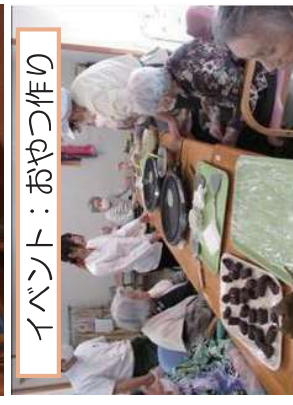
イベント：おやつ作り